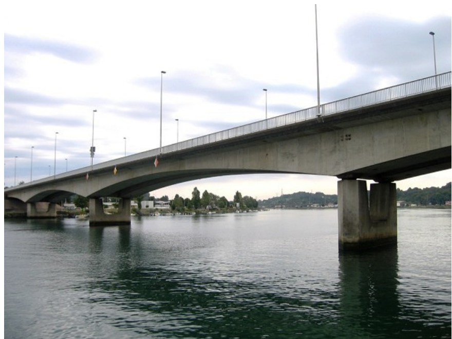
Betoizko eraikuntza : St Frederic zubia Baionan