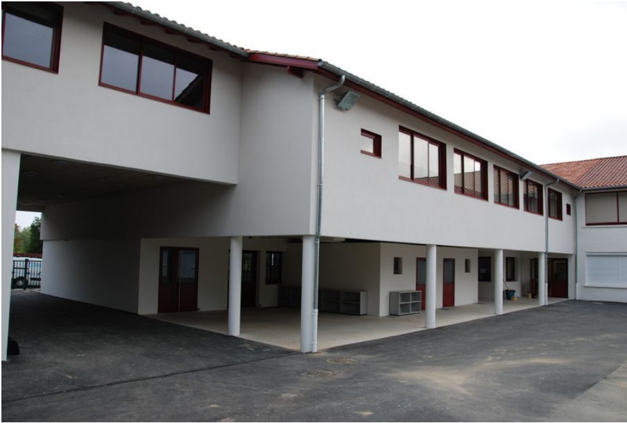
Betoizko eraikuntza : Xalbador kolegioa