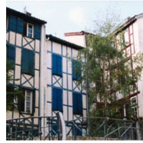
Eraikin berriek hartzen duten itxura