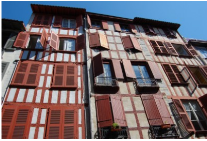
Gune babestua, historikoa...